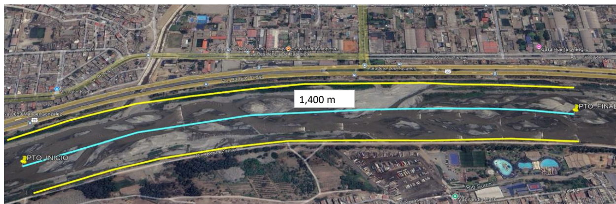
5.- IMAGEN SATELITAL DE ZONA VULNERABLE(GOOGLE EARTH)