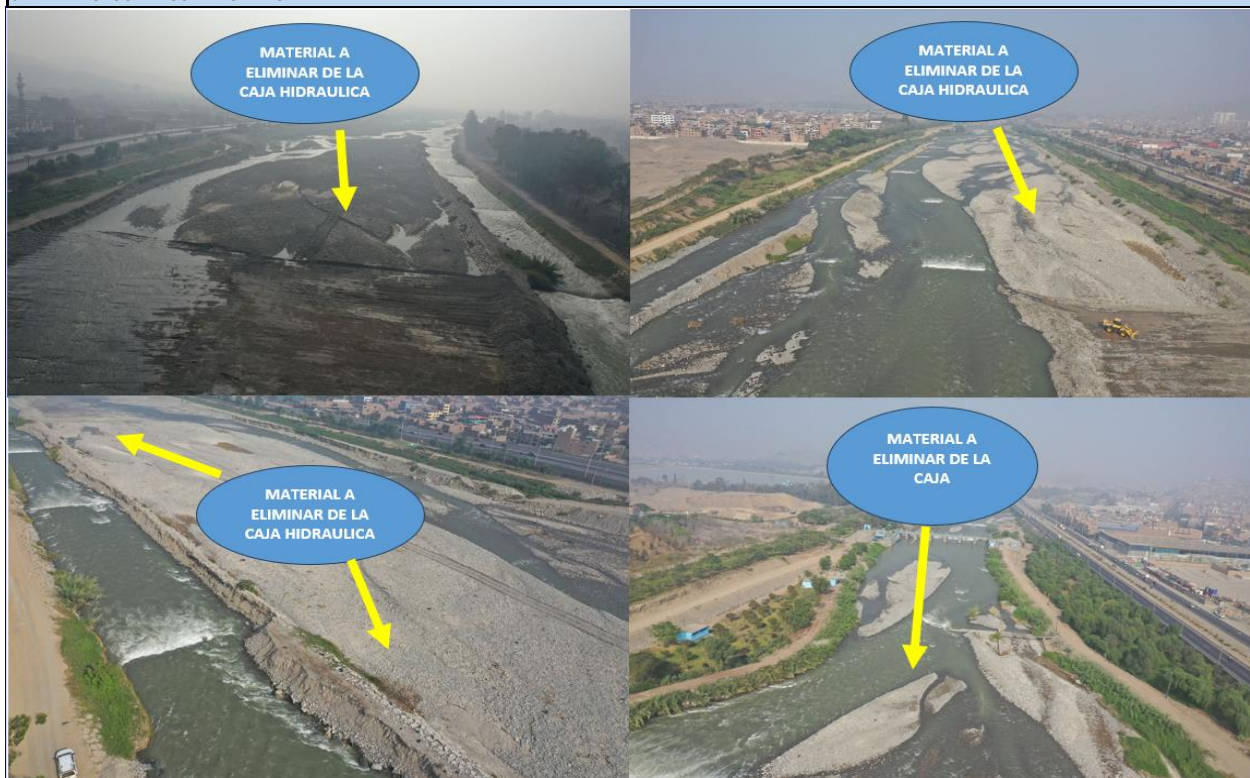
ZONA COLMATADA DEL RIO RIMAC - SECTOR LA ATARJEA PANTALLA 27 AL 13